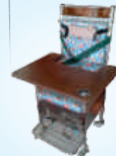
सेरेब्रल पाल्सी खुर्ची