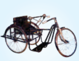
तीन चाकी सायकल