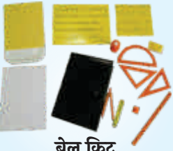
ब्रेल किट (शाळेतील मुलांसाठी)