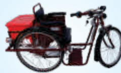
मोटारचलित तीनचाकी सायकल